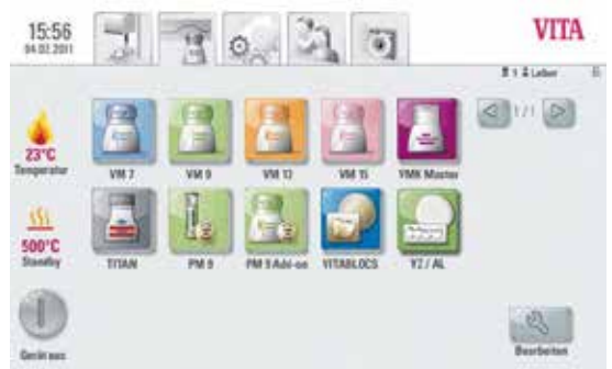
例如VITA vPad comfort 舒适控制屏

这种便利是由于使用了大屏幕彩色触控屏以及结构良好的菜单和符号，保证直观操作，创造了一个舒适友好的工作环境。