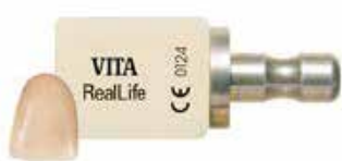
精细颗粒长石类瓷块