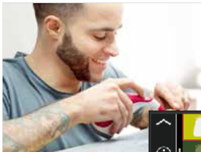
图3.目标修复体颜色比较