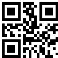
Abilita lettura codice a barre bidimensionale inverso