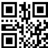
Time interval setting to read the duplicate barcode